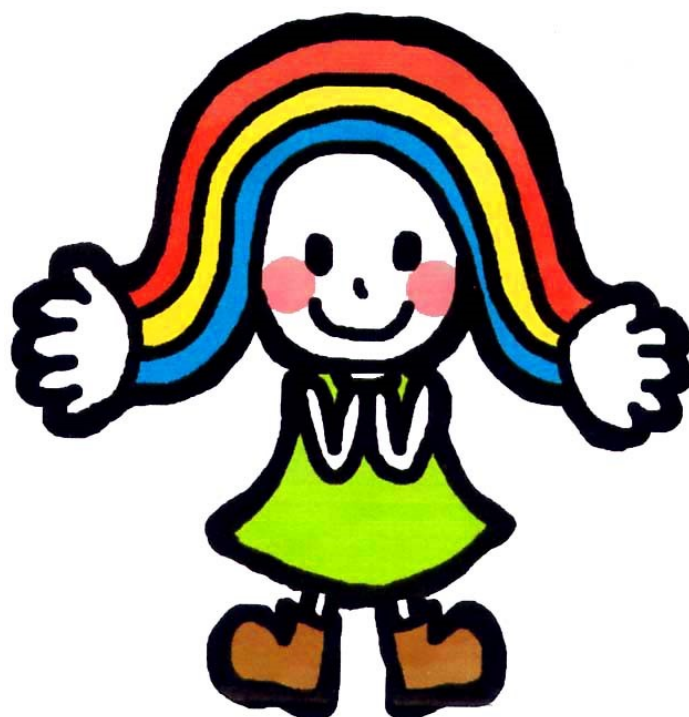
緑区社協マスコットキャラクター にじーな