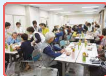
いきいき暮らしの講座