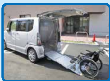
車いす対応車両貸出