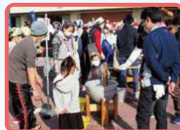
ふれあい餅つきまつり