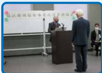
緑区地域福祉のつどい