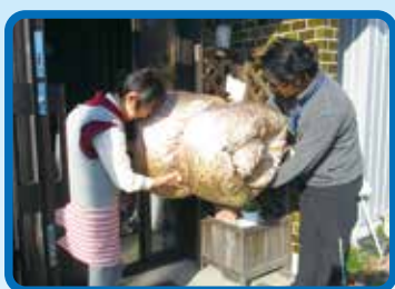
寝具クリーニングサービス事業