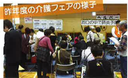
昨年度の介護フェアの様子