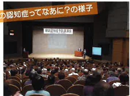
昨年度の認知症ってなあに?の様子

緑区地域包括ケア推進会議ウェブサイト ( http://midori-ho.jp/ ) もぜひご覧ください