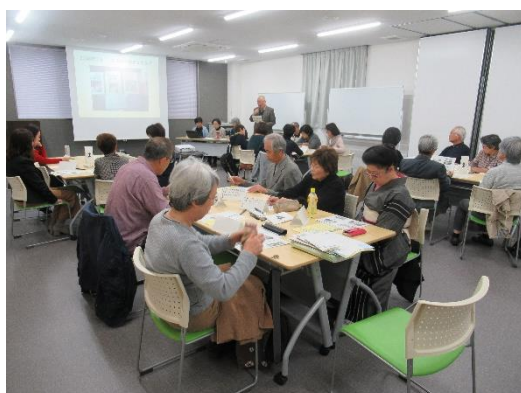
6~7名のグループに分かれて意見交換