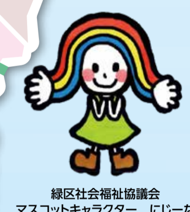
緑区社会福祉協議会 マスコットキャラクター にじーな