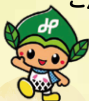
みどりっち 緑区マスコットキャラクター

緑区内の生活支援に関するサービス、見守りに関するサービス、 地域活動などをとりまとめました。 日常生活でちょっとした困りごと、心配ごとなどが生じた際、 ご活用ください。