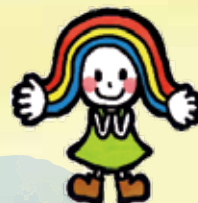
にじーな 緑区社会福祉協議会 マスコットキャラクター