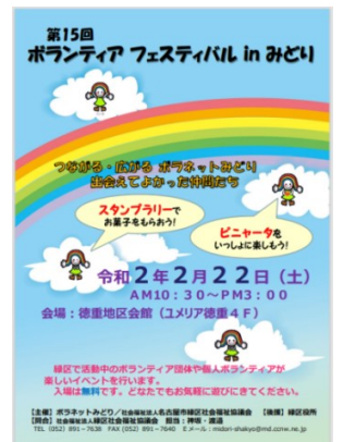
2019年度のチラシ表紙