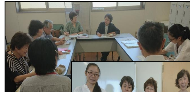
写真：左から役員会、役員の皆さん、定例会

この役員会ですが、定例会の準備会ですので、役員以外の参加も大歓迎です。お待ちしております。