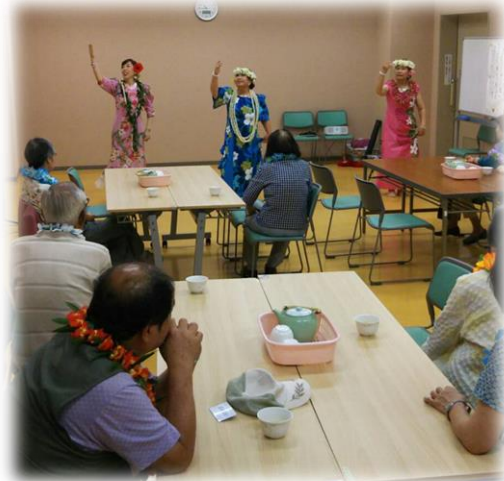
写真はいずれも片平ふれあいセンターでの活動の様子